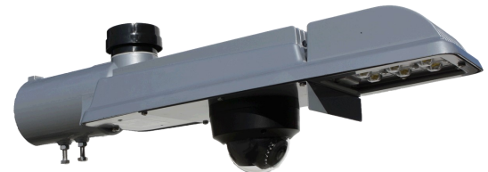
Cámara IP LITE con HotSpot